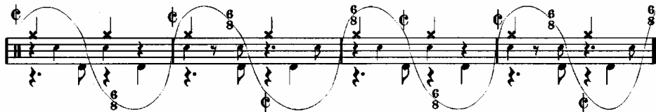
Notenbeispiel aus: Maturano (2001, S. 118)

Taktarten zu einem verwobenen Gefühl kommt, in dem dieser Wechsel nicht mehr von Pattern- oder Taktgrenzen abhängt. In der Zeitschrift Drums&Percussion finden wir folgende grafische Darstellung der hiermit angesprochenen Verflechtung unterschiedlicher Pulsationen.