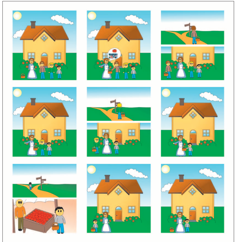
Abb. 3 Aufgabe aus QUIS: Fairy Tale – Topic and Focus in Coherent Discourse (Skopeteas et al. 2006: 149ff.)

Die Menge und Vielfalt der im SFB erhobenen und annotierten Sprachdaten stellt erhebliche Anforderungen an deren Management und Aufbereitung für linguistische Korpusstudien, stammen sie doch aus sehr verschiedenen Sprachen, umfassen elliptische Äußerungen genauso wie komplexe Sätze, Frage-Antwort-Paare, längere Dialoge und schließlich komplette Tex-