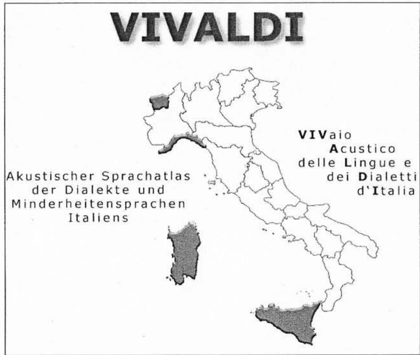
Abb. 2: VIVALDI-Startseite