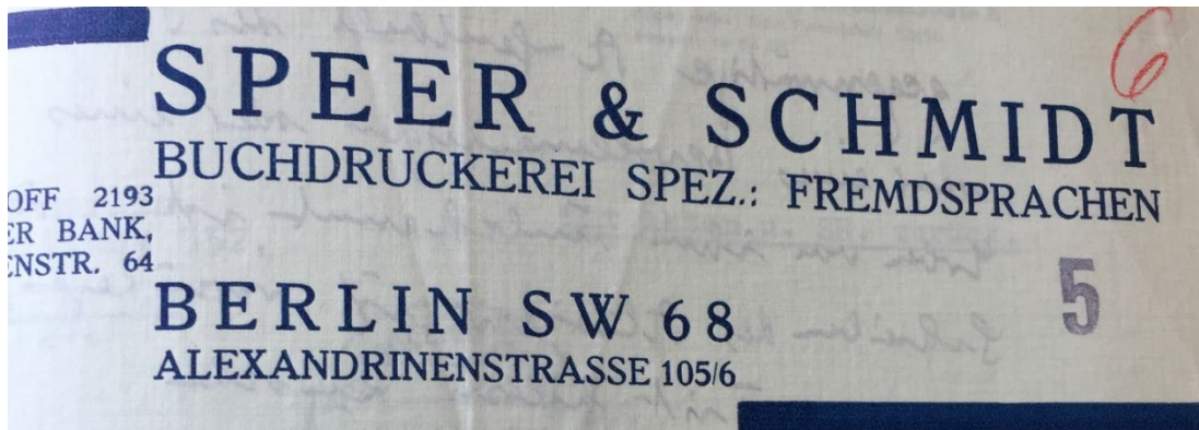
Figure 1: Letterhead for Speer & Schmidt Buchdruckerei, 28 th of September 1933, LArch: A Rep. 342-02; Nr. 40780, p. 6.