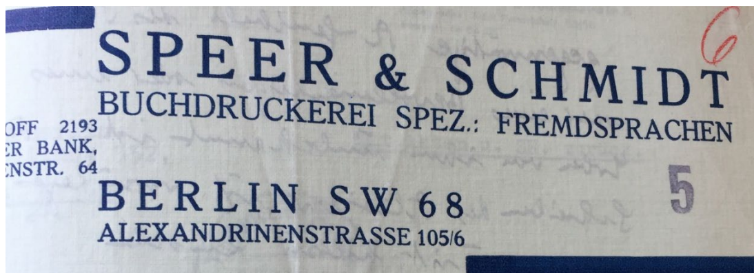
Abbildung 1: Briefkopf der Speer & Schmidt Buchdruckerei, 28. September 1933, LArch: A Rep. 342-02; Nr. 40780, S. 6.