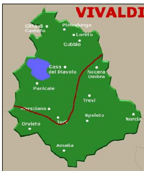
Abbildung 3: Umlautgrenze nach Reinhard