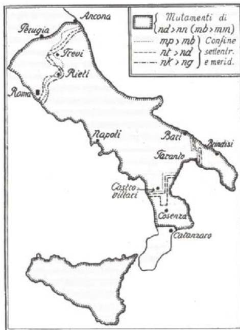
Abbildung 4: Progressive Assimilation und Lenisierung in Mittel- und Süditalien (aus: Tagliavini, 1982: 102)

Abbildung 4 gut zu erkennen ist, wobei die Grenze von ld > ll am nördlichsten verläuft.