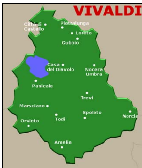
Abbildung 1: VIVALDI-Aufnahmepunkte in Umbrien

In diesem Beitrag sollen die aktuellen Merkmale der in Umbrien gesprochenen Dialekte anhand primärer Quellen dargestellt werden, wobei phonetische, morphologische und lexikalische Besonderheiten im Vordergrund stehen. Zu Grunde liegen Tonaufnahmen aus folgenden 14 VIVALDI Aufnahmeorten (in Klammern die Ortskennziffern des AIS und ggf. des ALI): Città di Castello, Pietralunga, Loreto (AIS 556), Gubbio, Casa del Diavolo, Nocera Umbra (AIS 566), Panicale (AIS 564), Trevi (Bovara), Marsciano (AIS 574, ALI 564), Orvieto (AIS 583), Todi (ALI 573), Spoleto (ALI 575), Norcia (AIS 576, ALI 577) und Amelia (AIS 584). 1